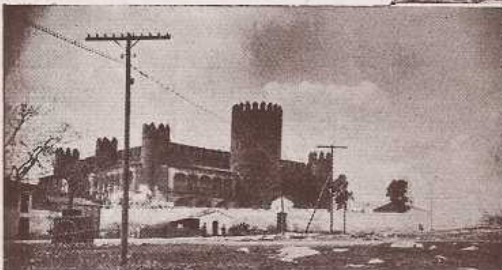
Línea Sevilla-Zafra, pasando junto al castillo del duque de Medinaceli