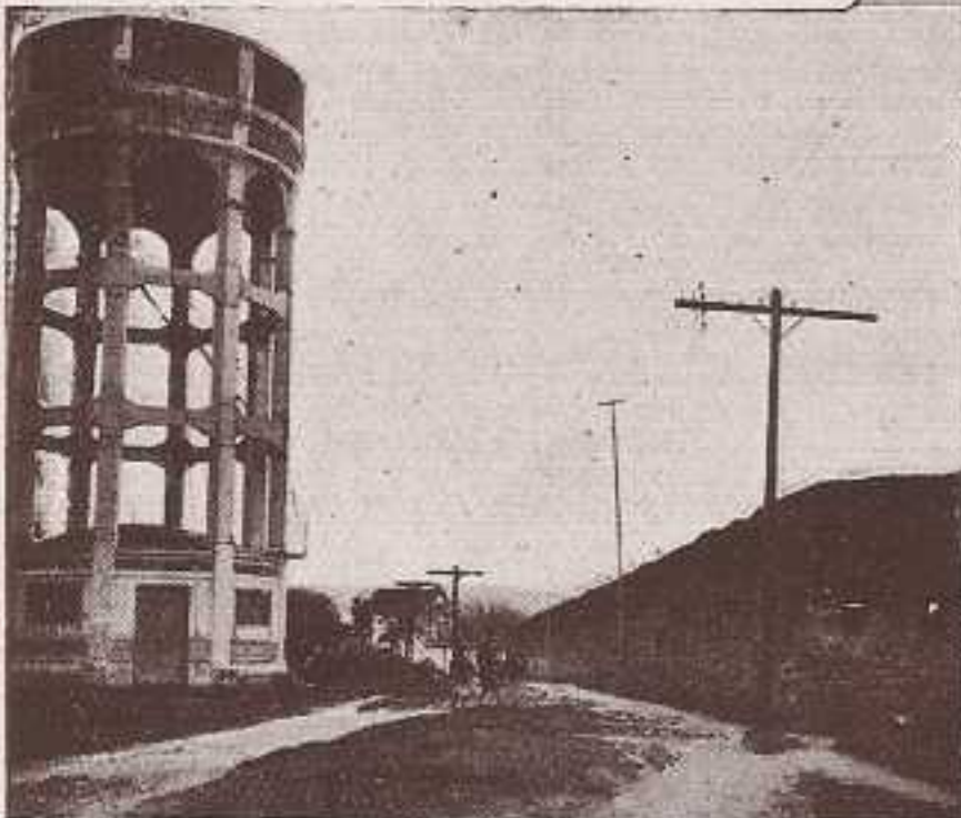
Línea Coruña-Ferrol, entrando en ésta por la calle Alegre